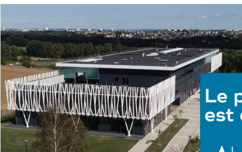
Usine de la prise d'eau de l'Orne

Un programme pensé par les acteurs du territoire (élus, agriculteurs...) et les partenaires techniques et financiers