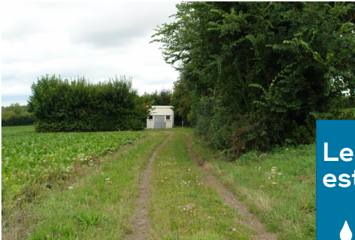
Forage F8 Amblie

Le programme d'actions est composé de 3 volets :